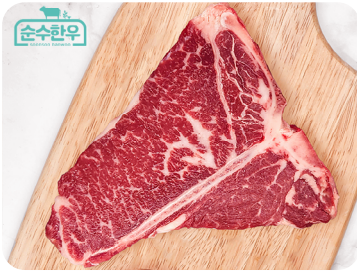
[순수한우] 캠핑에 빠질 수 없는 한우 티본스테이크 500g [시즈닝 증정/냉장]

순수한우 티본스테이크는 육즙과 고루 분포된 마블링이 매력적인 채끝살 언제나 인기 만점인 담백하고 부드러운 안심이 공존하는 부위입니다.