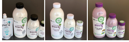
디어팜 무가당 수제요거트 디어팜 유기농 수제요거트 디어팜 블루베리 수제요거트