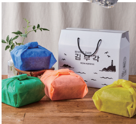
수제 찹쌀 김부각 선물포장