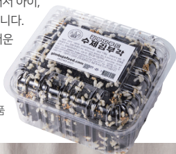
수제 찹쌀 김부각 단품

수제로 일일이 찹쌀 인자를 살려 찹쌀꽃이 핀 김부각입니다. 첨가제를 넣지 않고 만들어서 아이, 어른들 간식으로도 좋습니다. 또한 한복 느낌의 고급스러운 선물세트도 구성되어 있습니다.