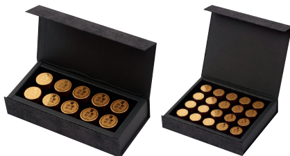
천을 공보진단 10환

뉴질랜드산 녹용분말, 국내산 6년근홍삼, 국내산 산수유, 국내산 신당귀, 국내산 속지황, 인도네시아산 침향, 국내산 진피를 법제 > 건조 > 제분 > 혼합 > 이물질 검사 후 국내산 천연 벌꿀로 반죽하여 6g으로 제한한 건강환으로 업무로 인한 스트레스가 많은 직장인들, 기력회복이 필요하신 부모님들, 체력 유지가 필요한 학생들, 가사노동으로 지친 주부들, 귀한 분들께 드릴 감사 선물 이 필요한 분들께 좋은 제품입니다.