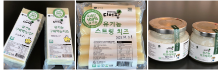
유기농 구워먹는치즈 유기농 스트링치즈 유기농 리코타치즈